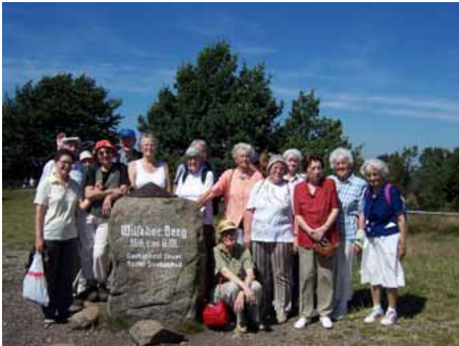
Wanderung zum Wilseder Berg

Alle Wanderungen bieten die Möglichkeit zur Einkehr (wird vorab zu sehr moderaten Preisen organisiert) und zu einem gemütlichen Beisammensein. Naturerlebnisse, Naturbeobachtungen, viele Informationen über die Umwelt und Geschichte, nette Gespräche und so manche Anekdote der beiden Leiter sind inklusive.