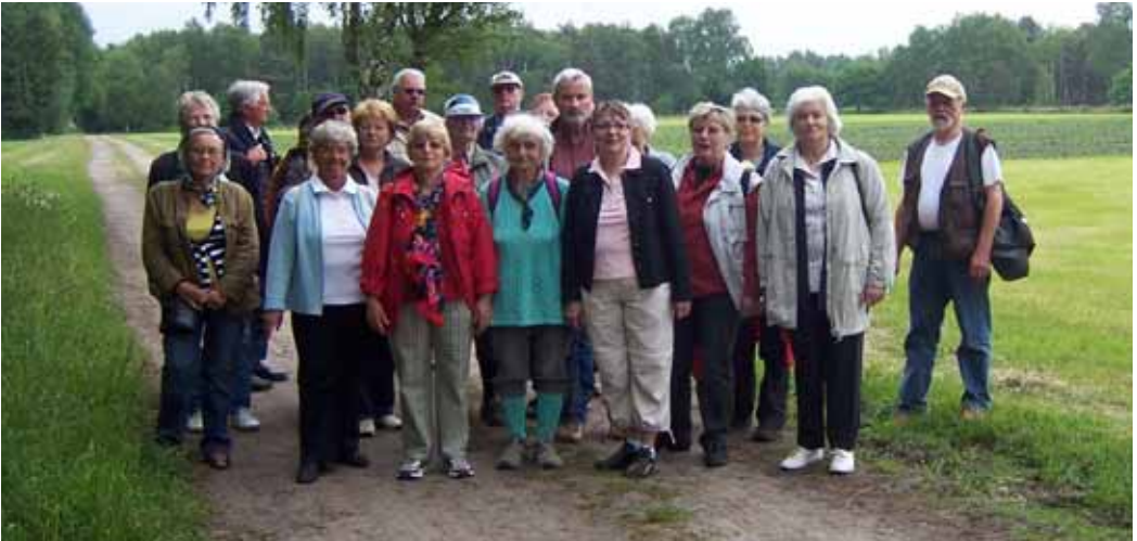
Wanderung nach Schneverdingen